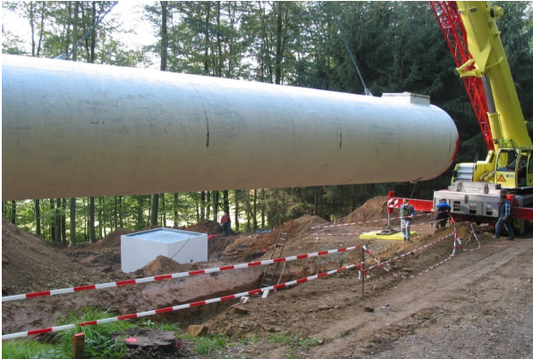
Einbau des Hochbehälters in Eboldshausen.